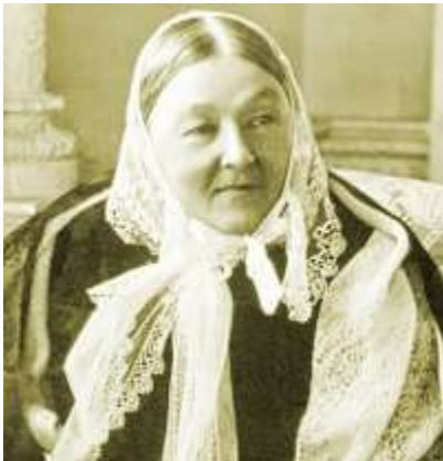
വർഷങ്ങൾക്ക് ശേഷം ഫ്ലോറൻസ് നൈറ്റിംഗേൽ