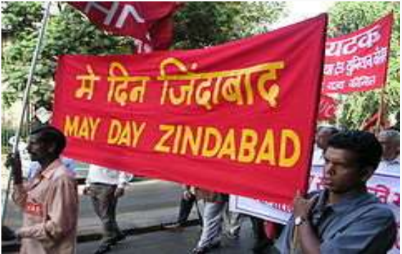
ഇന്ത്യയിലെ മുംബൈയിൽ നടന്ന ഒരു മേയ് ദിന റാലി

കൊവിഡിന് ശേഷം തൊഴിൽ രംഗത്ത് ഒരുപാട് മാറ്റങ്ങൾ ഉണ്ടാകാൻ സാധ്യതയുണ്ട്. ചില വിചാരങ്ങൾ താഴെകൊടുക്കുന്നു.