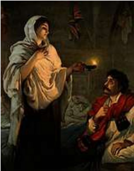
ഫ്ലോറൻസ് നൈറ്റിംഗേലിന്റെ വിളക്കേന്തിയ വനിതയെന്ന പ്രശസ്തമായ ചിത്രം.

1858-62 കാലത്ത് ഇന്ത്യയിലെ ബ്രിട്ടീഷ് ആർമിയുടെ അരോഗ്യകാര്യങ്ങളെപ്പറ്റി പഠിക്കാനായി നിയമിച്ച “റോയൽ കമ്മീഷൻ ഓൺ ഇൻഡ്യ” യുടെ അദ്ധ്യക്ഷയായി ഇന്ത്യയിലും അവർ പ്രവർത്തിച്ചിട്ടുണ്ട്.