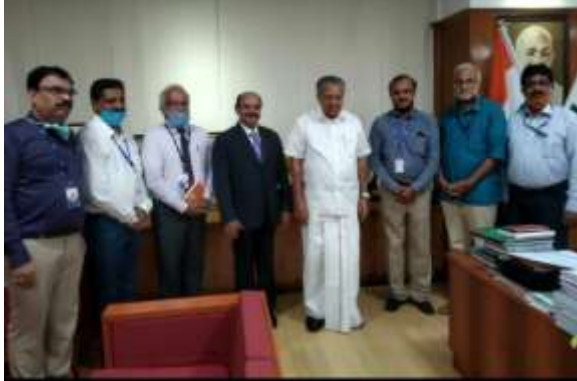
സ്റ്റേറ്റ് ബാങ്ക് ഓഫ് ഇന്ത്യ തിരുവനന്തപുരം സർക്കിളിലെ ജീവനക്കാർ CMDRF ലേക്ക് സമാഹരിച്ച തുക മുഖ്യമന്ത്രിക്ക് കൈമാറി. 6 കോടി രൂപയുടെ ചെക്ക് ആണ് നൽകിയത്.

എസ്.ബി.ഐ. പെൻഷനേഴ്സ് അസോസിയേഷൻ്റെ ആഹ്വാനം സ്വീകരിച്ചുകൊണ്ട് എസ്.ബി.ഐ. ഫെറലേഷൻ കൊവിഡ് 19 റിലീഫ് ഫണ്ടിലേക്ക് ഒരു ദിവസത്തെ പെൻഷൻ നൽകി ആ മഹത്തായ യജ്ഞത്തിൽ പങ്കാളി കളായതിന് നന്ദി. 272 പ്രവർത്തകരുടെ സഹകരണം കൊണ്ട് 3,59,320/- രൂപ സമാഹരിക്കാൻ സാധിച്ചു. എല്ലാ ഏരിയ കമ്മിറ്റികളും നന്നായി പ്രവർത്തിച്ചു. ഇതിൽ ചങ്ങനാശ്ശേരി ഏരിയ കമ്മിറ്റിയുടെ പ്രകടനം എടുത്ത് പറയേ തു്. 53 പേരെ പങ്കെടുപ്പിച്ചുകൊണ്ട് ചങ്ങനാശേരി മുൻപിൽ, ഏറ്റുമാനൂരിൽ നിന്ന് 52 പേർ പങ്കെടുത്തു. പാലായം കോട്ടയവും നന്നായി ചെയ്തു. ബാക്കി യുള്ളവ ചെറിയ എരിയ ആണെങ്കിലും അവരും ആകാവുന്ന രീതിയിൽ പരിശ്രമിച്ചു. എല്ലാവർക്കും അഭിനന്ദനങ്ങൾ!