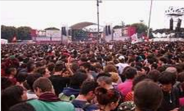
റോമിലെ ഒരു മേയ് ദിന ആഘോഷത്തിൽ നിന്ന്

1886 ൽ അമേരിക്കയിലെ ചിക്കാഗോയിൽ നടന്ന ഹേയ് മാർക്ക് കൂട്ടക്കൊലയുടെ സ്മരണാർത്ഥമാണ് മേയ് ദിനം ആചരിക്കുന്നതെന്നും കരുതപ്പെടുന്നു. സമാധാനപരമായി യോഗം ചേരുകയായിരുന്ന തൊഴിലാളികളുടെ നേർക്ക് പോലീസ് നടത്തിയ വെടി വെയ്പ്പായിരുന്നു ഹേമാർക്ക് കൂട്ടക്കൊലയോഗ സ്ഥലത്തേക്ക് ഒരജ്ഞാതൻ ബോംബെറിയുകയും, ഇതിനു ശേഷം പോലീസ് തുടർച്ചയായി വെടിയുതിർക്കുകയും ആയിരുന്നു.