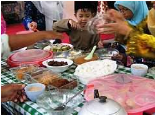
ഒരു പെരുന്നാൾ വിരുന്ന്

ഇൗദ് മുബറക്, കുല്ലു ആം അൻതും ബി വൈർ, തവബ്ബലല്ലാഹ് തുടങ്ങി വിവിധതരം ഇൗദ് ആശംസകൾ പ്രയോഗത്തിലുണ്ട്.