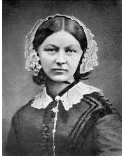
ഫ്ലോറൻസ് നൈറ്റിംഗേൽ ആദ്യകാല ചിത്രം

കൊവിഡ്-19 വൈറസിന്റെ ഭീഷണിയിൽ ജീവിക്കുന്ന ലോക ജനതയ്ക്ക് നഴ്സുമാരും, ഡോക്ടർമാരും മറ്റ് ആരോഗ്യ പ്രവർത്തകരും ദൈവതുല്യരായ മാലാഖമാരാണ്. അവർ ചെയ്യുന്ന സേവനത്തിന്റെ മാഹാത്മ്യം നാം കൂടുതൽ തിരിച്ചറിയുന്നു കൊറോണ വൈറസ് രോഗത്തിന്റെ പിടിയിൽ നട്ടം തിരിയുന്ന ആധുനിക ലോകത്ത് ഫ്ലോറൻസ് നൈറ്റിംഗേലിന്റെ സംഭാവനകൾ കൂടുതൽ പ്രസക്തമാണ്.